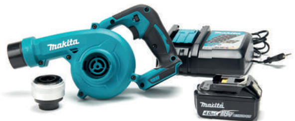
ProBag Tool Battery Inflator