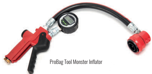
ProBag Tool Monster Inflator