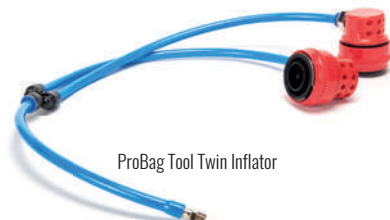
ProBag Tool Twin Inflator