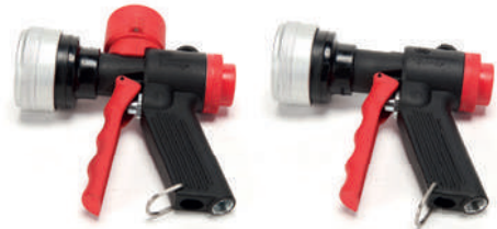
ProBag Tool Mini Jet flow y Mini Jet Flow sin manómetro

Amplia gama de pistolas de aire y accesorios para todo tipo de bolsas. Disponemos de pistolas inalámbricas con batería, pistolas con y sin manómetro, con sistema venturi, combos metálicos, adaptadores de doble boca, etc.